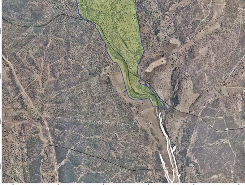
MAPA DE FIGURAS DE PROTECCIÓN Y BIENES DE DOMINIO PÚBLICO DEL T.M. DE PARRILLAS