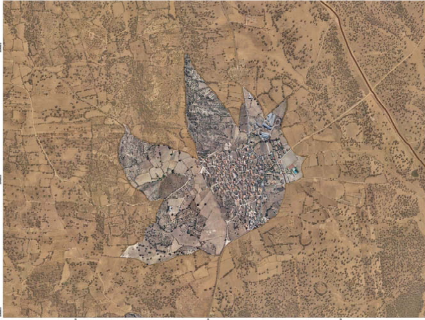
MAPA DE FIGURAS DE PROTECCIÓN Y BIENES DE DOMINIO PÚBLICO DEL T.M. DE PARRILLAS Límites en el entorno del casco urbano